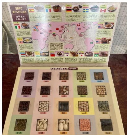
〈いろいろな豆の標本〉

2月は節分にちなみ、大豆や大豆の加工品を使った給食が多く登場しました。掲示物では大豆の加工品はどのような工程を経ると作られるのかを楽しみながら知ることができます。