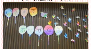
3年生が作成した体育館の飾り

先日、6年生に読み聞かせをする機会がありました。卒業前最後の一冊ということで随分迷いましたが、「たいせつなこと」(マーガレット・ワイズ・ブラウン作 レナード・ワイズガード絵 うちだややこ訳 フレーベル館)という絵本を選びました。この絵本は、身の回りにある一つ一つのものに「たいせつなこと」があること、そして、「あなたにとってたいせつなことは、『あなたがあなたであること』」を教えてくださいます。