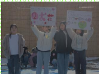
「うめころクイズチーム」

梅は中国から渡ってきたこと、小田原の梅は500年前から植えられていることなどをクイズ形式で紹介しました。