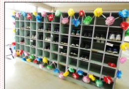
5年生が飾り付けをした下駄箱