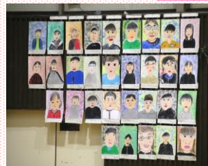
1,2年生が描いた6年生の似顔絵