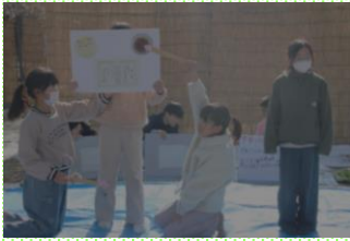
「梅戦士が乗りこえてきたことチーム」

クイズを入れたり図を使ったりして観客に梅のよさを一生懸命に伝える姿から、下曽我の子であるという誇りと自信を感じました。