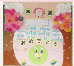
4年生が作成した 6年生教室前の飾り