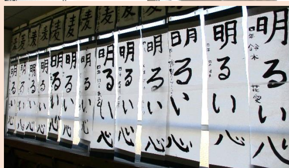
お手本をよく見て、丁寧に書く6年生の様子