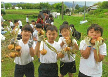
2年生の玉ねぎの収穫

5月27日(月)は2年生の玉ねぎの収穫、30日(木)は1年生と6年生のサツマイモの苗の植付など、今年度の農園活動も充実してきました。サツマイモの苗の植え付けでは、6年生が1年生にやさしく寄り添いながら苗を植えていました。1年生は6年生を頼りにしながら作業を進めていました。