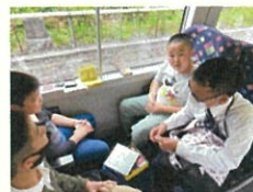
先生と一緒に カードゲーム