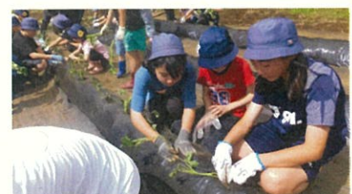
サツマイモの苗の植付

玉ねぎはスープ、サツマイモは焼き芋など、子どもたちにとって楽しみなことですが、収穫の喜びだけでなく、人・自然と関わりながら自然の大切さやそこで働く人の仕事に対する思いを感じ取ってもらえたらと思います。