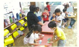
1年生が飾りを作りました