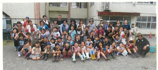
みんなで記念撮影 笑顔いっぱいです

学習参観日も兼ねて農園活動に参加していただいた保護者の皆様、子どもと一緒に活動いただきありがとうございました。一緒に参加している際に保護者の方から「久野小だけでしか経験できないことから。」という言葉が聞きました。今年度着任した私は色々な農業体験をさせていただき、「久野小だけの」という言葉の意味を実感しております。農園ボランティアの方々へ感謝の気持ちでいっぱいです。