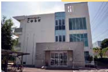
17 橋タウンセンター「こゆるぎ」