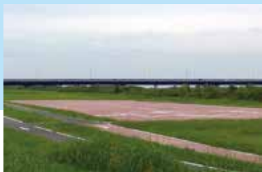
11 さか わ さ がん 酒匂川左岸 サイクリング場