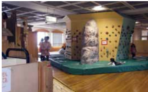
▲児童プラザラッコ