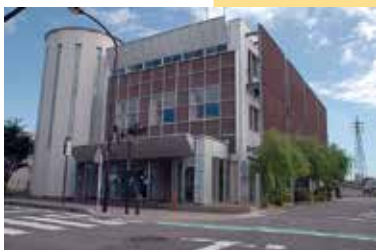
16 城北タウンセンター「いずみ」