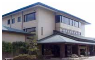
8 そん とう き ねん かん 尊徳記念館