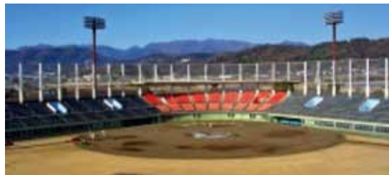
10 きゅうじょう 小田原球場