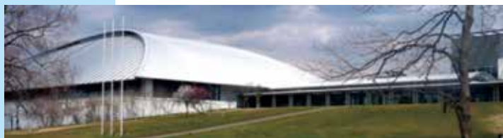
9 そうごう 小田原市総合文化体育館・小田原アリーナ