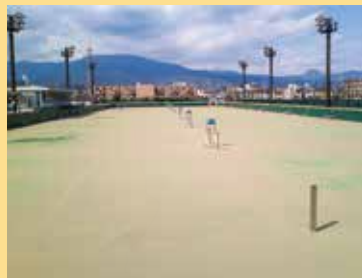
20 小田原テニスガーデン