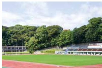
7 しろやま びくじょうきょう ぎじょう 城山陸上競技場