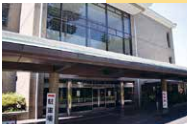
15 生きがいふれあいセンター「いそしぎ」