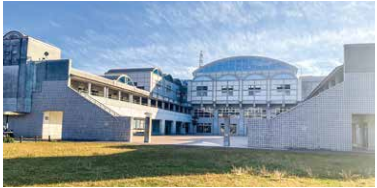
▲川東タウンセンター「マロニエ」

小田原市には、市役所や川東タウンセンター「マロニエ」のように、いろいろな公共施設がありますが、それぞれ働きがちがいます。