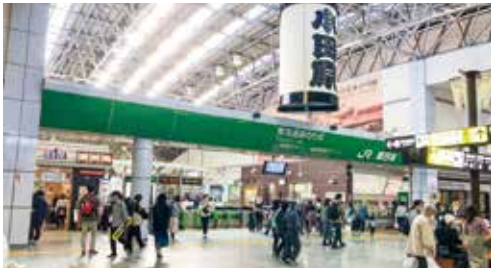
▲小田原駅 えき JR改札口 かいさつぐち

小田原駅 えき には、JR東海道線 ジェイアールとうかいどう や小田急線 おだきゅう などの、いろいろな鉄道 てつどう が集まっています。多くの人たちがのりおりしています。また、小田原駅 えき 前には、タクシー ほうめん のり場や、いろいろな方面へのバスのり場があります。