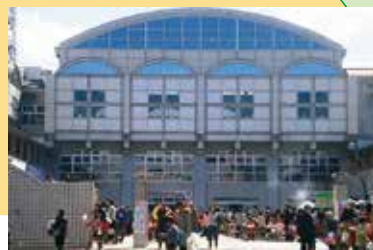
14 川東タウンセンター「マロニエ」