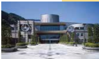
18 県立生命の星・地球博物館