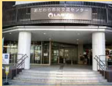
19 おだわら市民交流センター UMECO