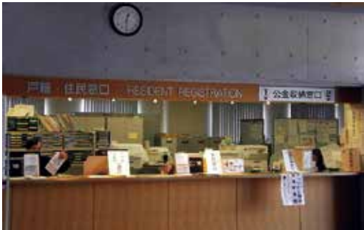
▲マロニエ住民窓口