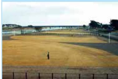
12 さか わ 酒匂川スポーツ広場