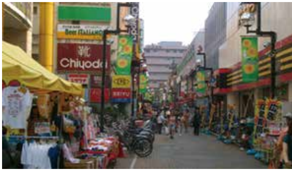
小田原 えき 駅の周辺