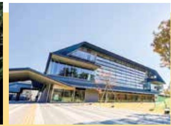
3 小田原三の丸ホール